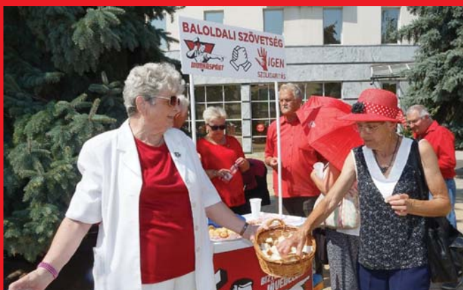
JÓ HANGULATBAN ÜNNEPELTÜNK