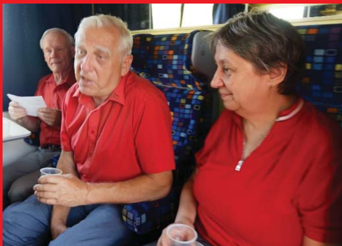
BUDAPESTIEK ÚTON MISKOLCRA

Miskolcon volt a Munkáspárt idei országos rendezvénye. A siker feltétele mindig a jó szervezés és a párt tagjainak lelkesedése. Az idén nem volt hiány egyikből sem. Képeink a miskolci ünnepség szép pillanatait idézik fel.