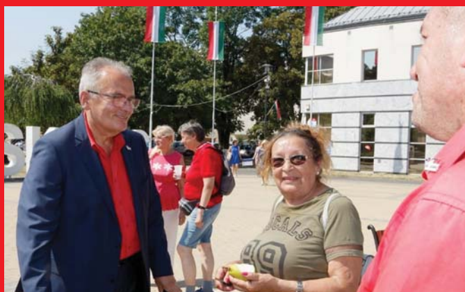
A HAJDÚSÁGBÓL IS SOKAN JÖTTEK