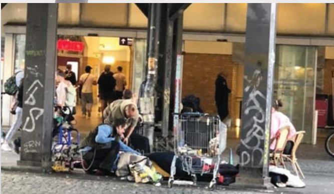
BERLIN-ALEXANDERPLATZ: MIGRÁNSTANYA A FŐVÁROS KELLŐS KÖZEPÉN