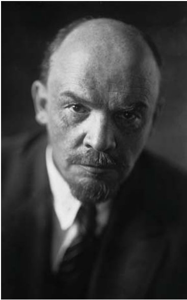
SZERZŐ: VLAGYIMIR ILJICS LENIN

és liberális tudomány védelmezi a bérrabszolgaságot, a marxizmus viszont könyörtelenül hadat üzen ennek a rabszolgaságnak. A bérrabszolgaság társadalmában elfogulatlan tudományt várni - ez éppoly bárgyú naivság lenne, mint elfogulatlanságot várni a gyárosoktól abban a kérdésben, hogy fel kell-e emelni a munkások bérét a tőke profitjának rovására.