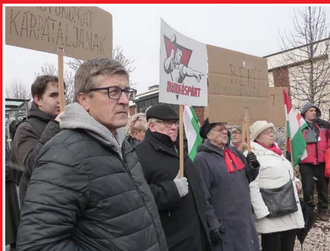
2023. JANUÁR 28. EGYÜTT A BÉKEKÖRREL, A BÉKEFÓRUMMAL ÉS MÁS SZERVEZETEKKEL AZ UKRÁN NAGYKÖVETSÉG ELŐTT