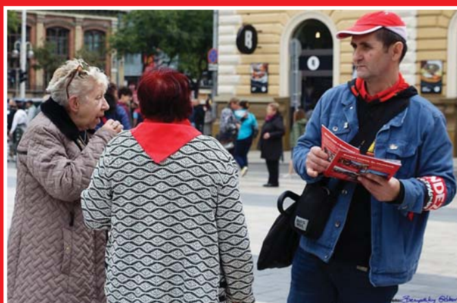
2022. SZEPTEMBER 26. NYUGATI TÉR