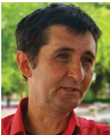
SZERZŐ: BALANYI ISTVÁN AZ ORSZÁGOS ELNÖKSÉG TAGJA

Kezdjük a tényekkel! Münnich Ferenc Seregélyesen született 1886. november 16-án, Budapesten 1967. november 29-én hunyt el.