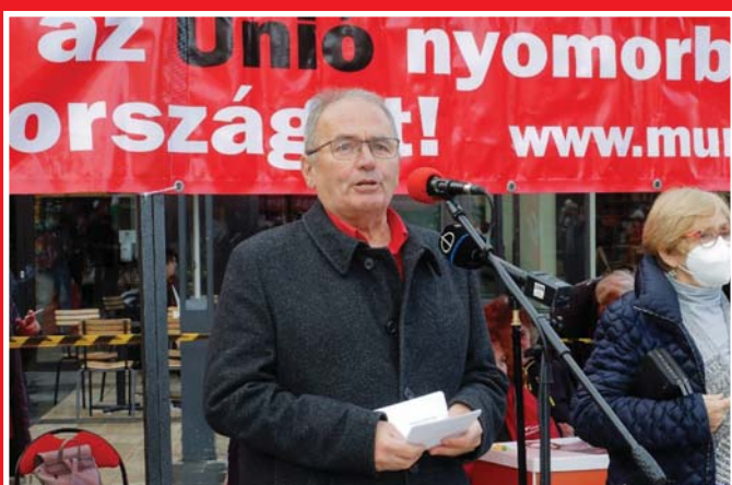
2022. NOVEMBER 7. NYUGATI TÉR, THÜRMER GYULA BESZÉL