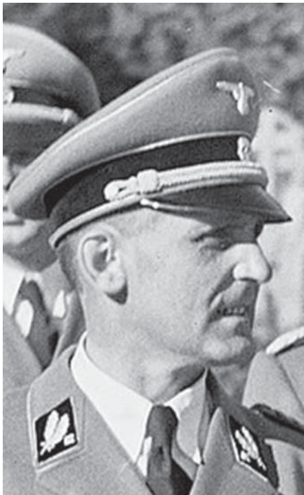
HEINRICH MÜLLER, A GESTAPO EGYKORI FŐNÖKE

Az EU rendelkezett arról, hogy a tagállamoknak át kell venniük ezt a szabályt: