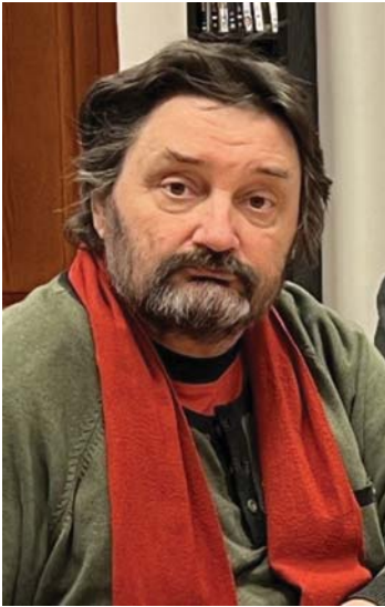
SZERZŐ: KÓS ZOLTÁN AZ ORSZÁGOS ELNÖKSÉG TAGJA