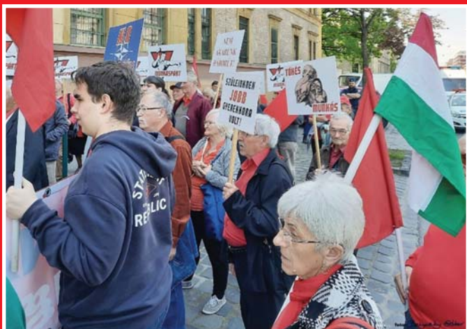
2022. MÁJUS 1. MUNKÁSPÁRT BÉKEGYÜLÉS A HONVÉDELMI MINISZTERIUM ELŐTT

Részt vettünk más háborúellenes szervezetek rendezvényein.