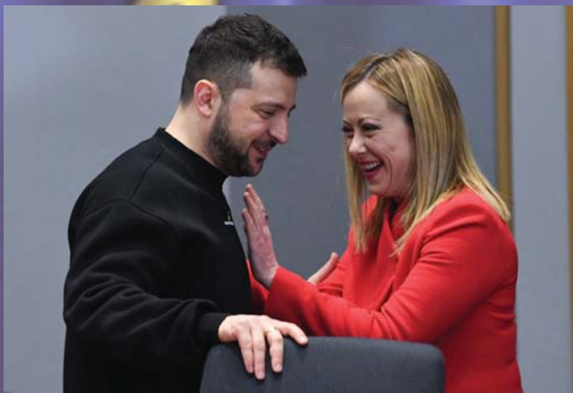
MELONI OLASZ MINISZTERELNÖK: HADD SIMOGASSALAK MEG!