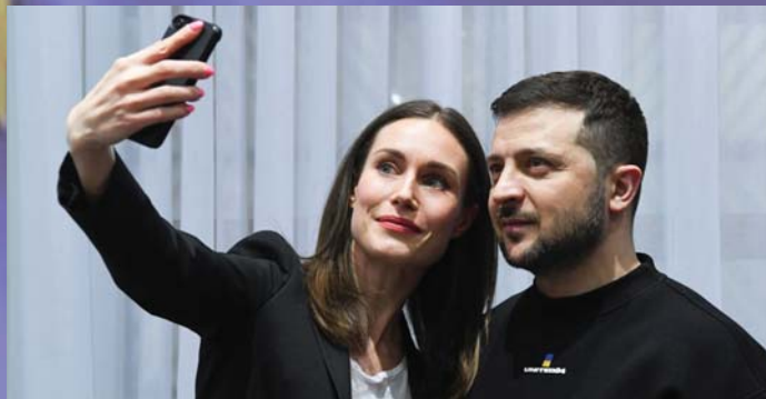
MARIN FINN MINISZTERELNÖKNŐ: EGY LAZA SZELFI, VOLOGYKA!

Az Európai Unió vezetői történelmi lehetőséget mulasztottak el. Közölhették volna Zelenszkij elnökkel, hogy Európa népei nem akarnak több vérontást, nem akarják a háború kiterjesztését, nem akarják, hogy atomháború pusztítsa el országaikat. De nem ezt tették! Az EU vezetői mosolyognak, tapsolnak Zelenszkijnek, szelfiznek vele, eközben pusztulásba, halálba sodorják Európa népeit. Legalább Orbán nem mosolygott.