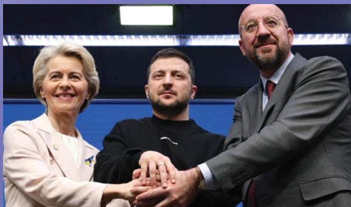
VON DER LEYEN EB-ELNÖK ÉS MICHEL ET-ELNÖK: KÉZ A KÉZBEN A HÁBORÚBA!

ORBÁN MAGYAR MINISZTERELNÖK: BIZTOS, HOGY EZ A MI VILÁGUNK?