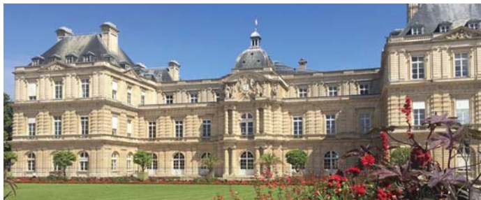
A PÁRIZSI LUXEMBOURG PALOTA – A BÉKETÁRGYALÁSOK SZÍNHELYE

te a háború utáni béketárgyalásokra való felkészülést. Pedig 1943 nyarán már régen túl vagyunk a sztálingrádi csatán, sőt már véget ért a kurszki csata is. A német hadsereg elveszti a stratégiai kezdeményezést, nagy támadó hadműveletekre már nem lesz képes. Már nem nyerhetnek a németek.