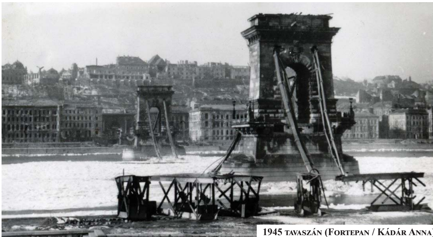
1945 TAVASZÁN

Nem gondoltuk 1955-ben sem, bár akkor már szemben állt egymással a szocialista országok védelmi szervezete, a Varsói Szerződés és a tőkés nyugat blokkja, a NATO. Bízunk a szocializmus, a Szovjetunió erejében.