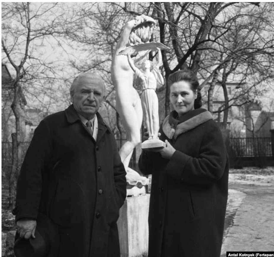
Antal Kotnyek (Fortepan)