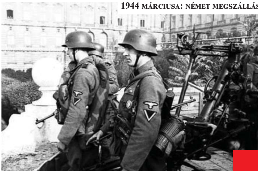
1944 MÁRCIUSA: NÉMET MEGSZÁLLÁS

Minden évben emlékezünk a felszabadulásra, de minden év más és más. 1945 áprilisában örültünk, hogy vége a háborúnak, és sohasem gondoltuk, hogy újra megélhetjük a háborút Európában.