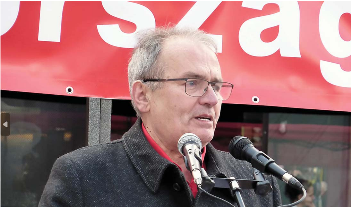
2023 MÁRCIUSA: A BÉKÉÉRT TŰNTETÜNK

Hetvennyolc esztendeje, 1945. április 4-én az utolsó német katona is elhagyta Magyarországot. Megszűnt az ország német megszállása, Magyarország felszabadult.