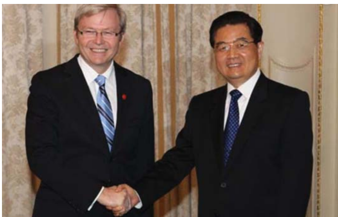
2009: HU CSIN-TAO KÍNAI ELNÖK KEVIN RUDD AUSZTRÁL MINISZTERELNÖKKEL

„A Kína és az Egyesült Államok között tíz éven belül katonai konfliktus következhet be. Nem törvényszerű, de a konkrét lehetősége adott” – írja könyvében Kevin Rudd.