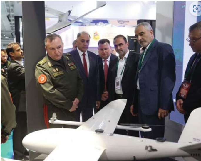
BELARUSZ KATONAI VEZETŐK A SAJÁT FEJLESZTÉSŰ REPÜLŐESZKÖZÖK STANDJÁN