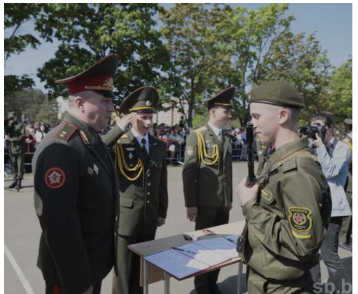
AZ IDÉN MÁJUSBAN IS TÖBBEZER FIATAL TETTE LE A KATONAI ESKÜT