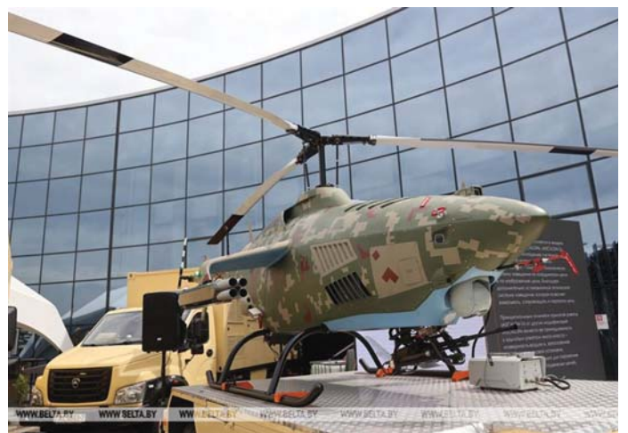
BELARUSZ GYÁRTÁSÚ PÍLÓTA NÉLKÜLI ESZKÖZÖK