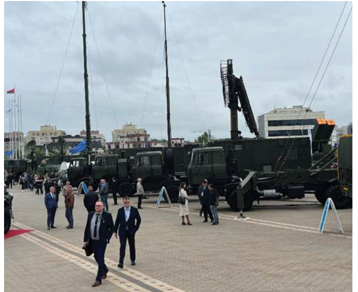
DRÓN FELDERÍTŐ ÉS ELHÁRÍTÓ ESZKÖZÖK