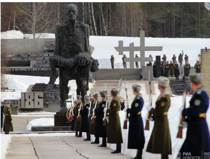
A BELARUSZOK NEM FELEJTIK A HÁBORÚ ÁLDOZATAIT