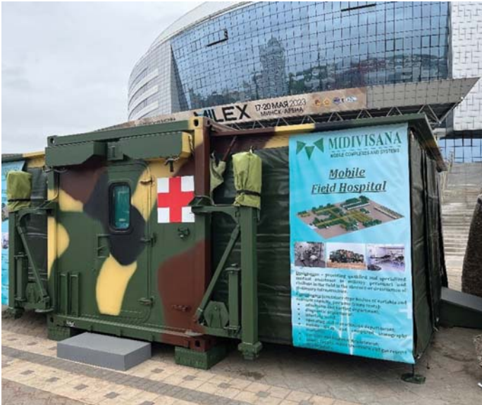
MOBIL TÁBORI KÓRHÁZ A KIÁLLÍTÁSON