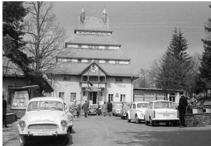
SZAKSZERVEZETI ÜDÜLŐ MÁTRAHÁZÁN A SZOCIALIZMUSBAN

Vagyis a szocializmusban a népé a hatalom, a kapitalizmusban csak forrása, azaz hivatkozni lehet a népre. Mindkét rendszerben a nép képviselői útján dönt, de a szocializmusban