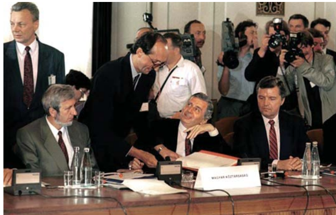
ANTALL JÓZSEF 1991-BEN ALÁÍRJA A VARSÓI SZERZŐDÉS FELMONDÁSÁRÓL SZÓLÓ EGYEZMÉNYT

A NATO-csatlakozásnak ára volt, és ezt árat a mai napig fizetjük. A NATO két héttel a csatlakozásunk után lerohanta Jugoszláviát. A háborúhoz felhasználta a magyar területet, légteret, közutakat és vasutakat.