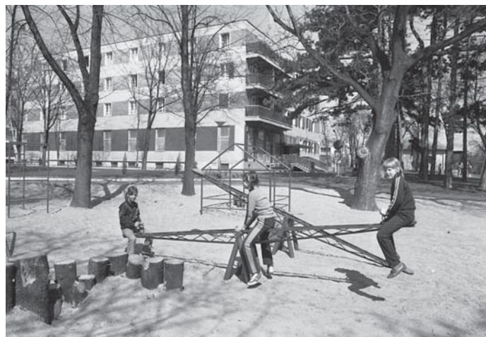
BALATONFÜREDI BM-ÜDÜLŐ

A kapitalizmusban az árak csak töredéke a termelési önköltség. Hozzá jönnek az óriási reklámköltségek, a minél nagyobb profit betervezése.