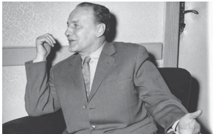
KÁDÁR JÁNOS, A NYOMDA-, A PAPÍRIPAR ÉS A SAJTÓ DOLGOZÓI SZAKSZERVEZETÉNEK KÖZPONTI VEZETŐSÉGÉNEK ÜLÉSÉN, 1962-BEN.

A szocializmusban a munka kötelező volt, és az állam ehhez megteremtette a feltételeket. Gyárakat épített, munkahelyeket teremtett. Nem csak az volt a fontos, hogy az emberek pénzt keressenek. Az is fontos volt, hogy az emberek megtalálják helyüket a társadalomban és mindenki érezze, hogy biztonságban van.