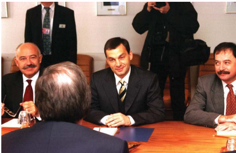
ORBÁN VIKTOR MINISZTERELNÖK 1999-BEN A NATO FŐTITKÁRÁNÁL

mánya kinyilvánította a Varsói Szerződésből való kilépés szándékát. A november 4-ei katonai beavatkozás, amely a Kormányt megdöntötte, meggátolta a kilépési nyilatkozat törvényerőre emelését. A szabadon megválasztott Országgyűlés most újjólág kinyilvánítja Magyarországnak a Varsói Szerződésből való kilépési szándékát.”