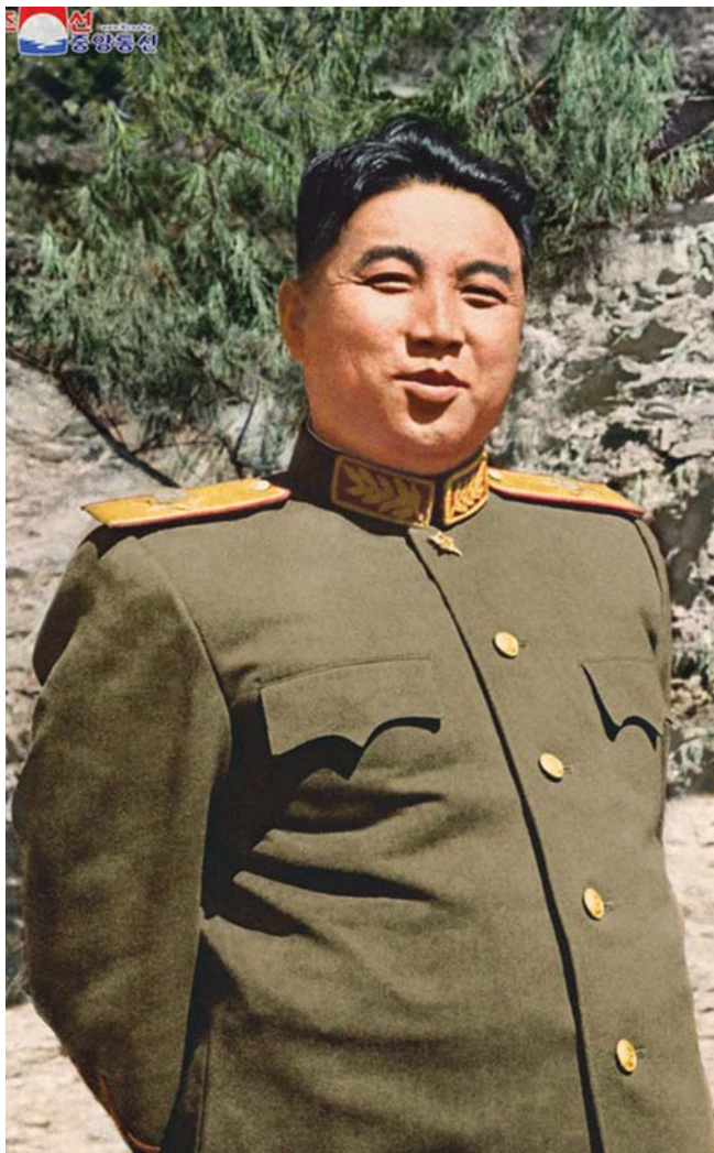
KIM IR SZEN, A KOREAI MUNKAPÁRT ÉS A KOREAI NÉPI DEMOKRATIKUS KÖZTÁRSASÁG VEZETŐJE, A HADSEREG FŐPARANCSNOKA