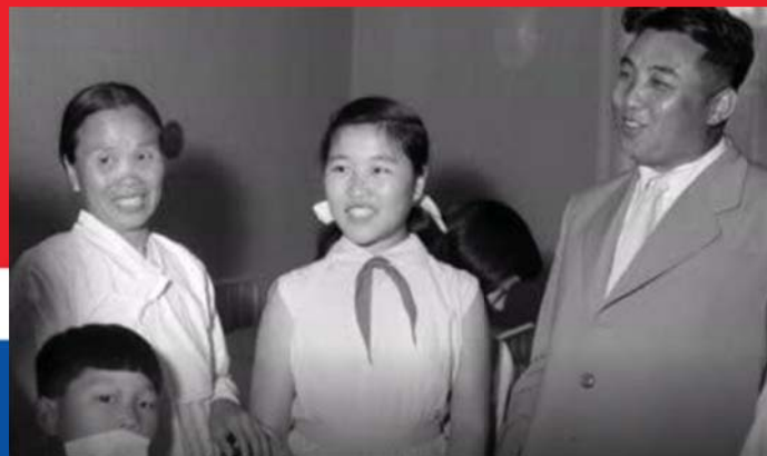
KIM IR SZEN BUDAPESTEN 1956-BAN