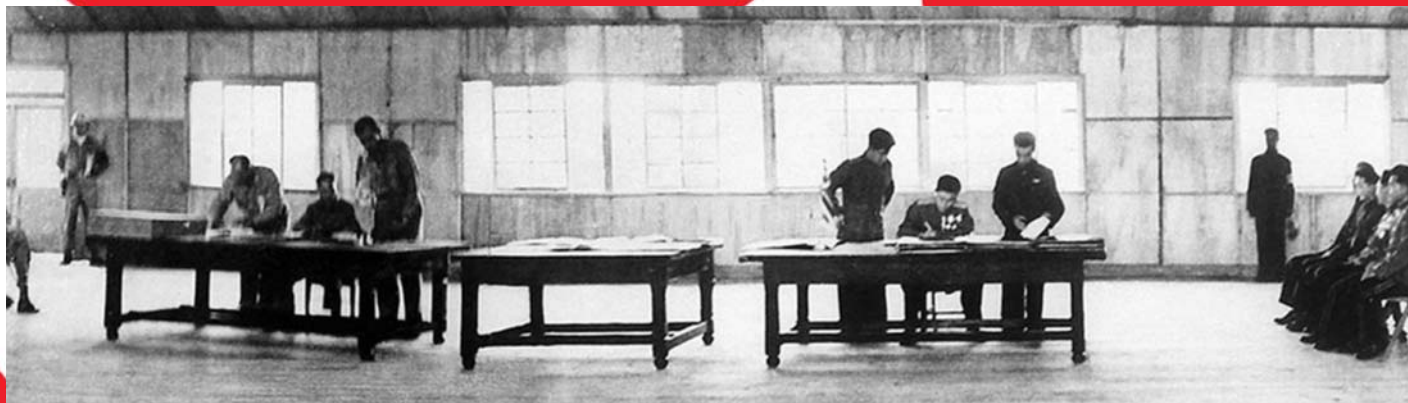
A FEGYVERSZÜNET ALÁÍRÁSA 1953-BAN