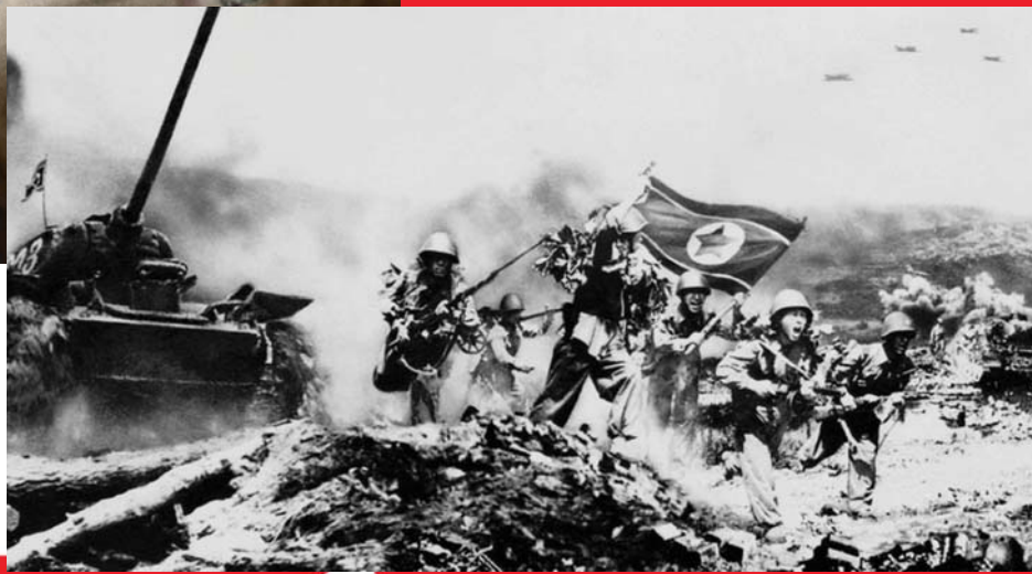
ÉSZAK-KOREAI CSAPATOK TÁMADÁSA