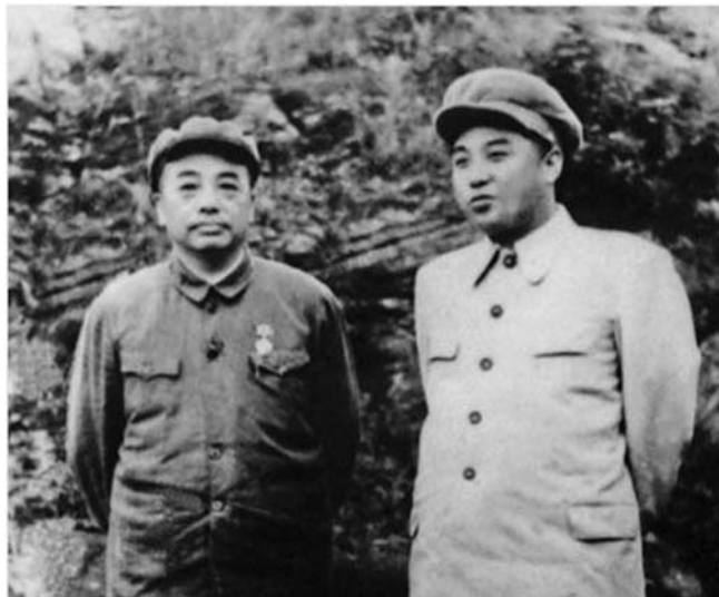
PENG DEHUAL, A KOREÁBAN HARCOLÓ KÍNAI ÖNKÉNTES CSAPATOK PARANCSNOKA ÉS KIM IR SZEN

A Kínai Népköztársaság vezetése fontos következtetéseket vont le a háborúból. Korszerű hadseregre van szükség, Kínának is atomhatalommá kell válnia. A koreai háború lökést adott a kínai gazdaság és hadsereg korszerűsítéséhez.