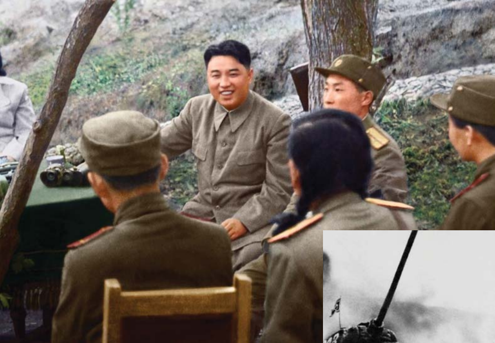
KIM IR SZEN A HÁBORÚ IDEJÉN