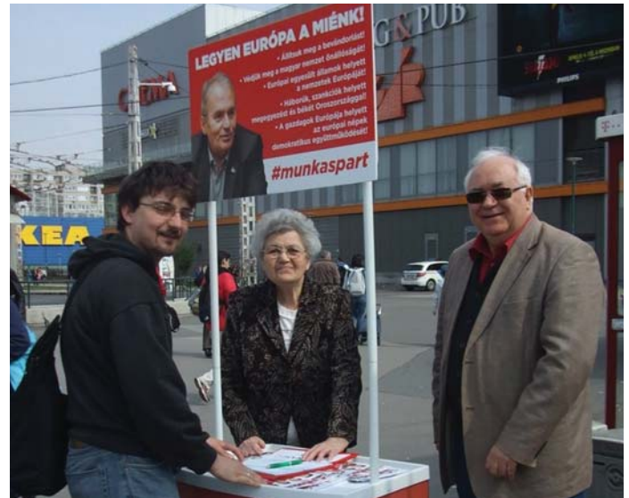
MUNKÁSPÁRTI KAMPÁNY – 2019