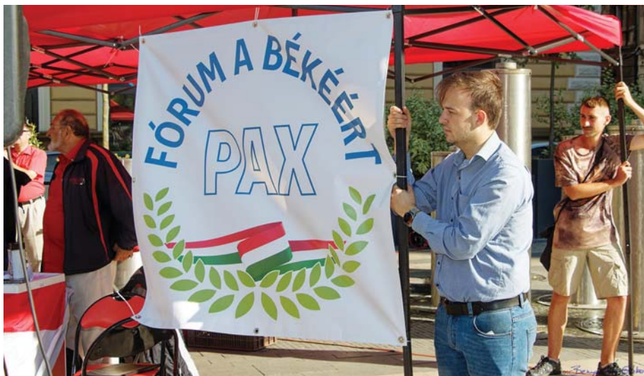
2023 – BÉKEGYŰLÉS BUDAPESTEN

Létrejöh-e olyan helyzet, amikor a kommunistáknak teljesíteniük kell történelmi küldetésüket, és megtenni azt, amiről Marx és Engels már 1848-ban beszélt: megdönteni a kapitalizmust?