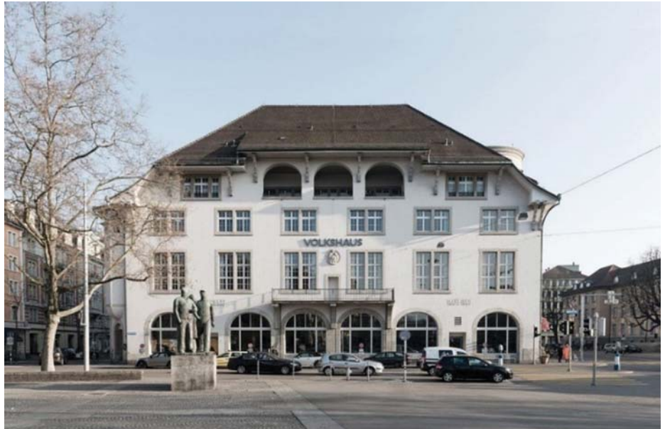
ZÜRICH, NÉPHÁZ, ITT BESZÉLT LENIN 1917 JANUÁRJÁBAN

„Lehetséges, hogy a burzsoázia békés úton átadja a hatalmat, ha meggyőződik az ellenállás reménytelenségéről” – írja ugyanekkor, de arra tanítja a környezetét, hogy ne üljenek fel illúzióknak. A burzsoázia könyörtelenül igyekszik mindent elnyomni, ami a létét fenyegeti.