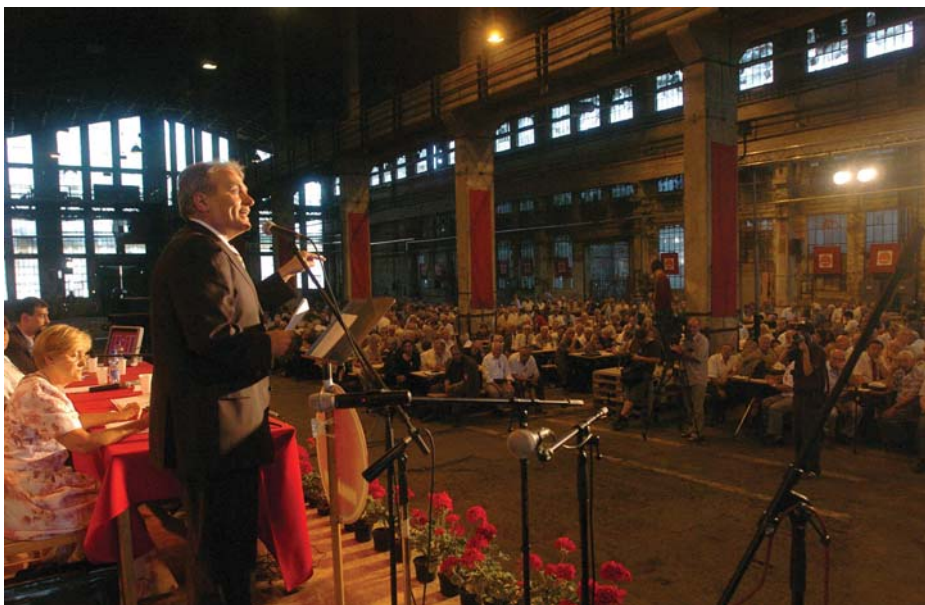
A MUNKÁSPÁRT CSEPELI KONGRESSZUSA 2007-BEN

Az amerikai bankok összeomlása a magyar középosztályt is érinti, mivel sokan amerikai részvényekbe fektettek. A középosztály kezd ráeszmélni, hogy a kapitalizmusban nem minden fenékig tejfel.