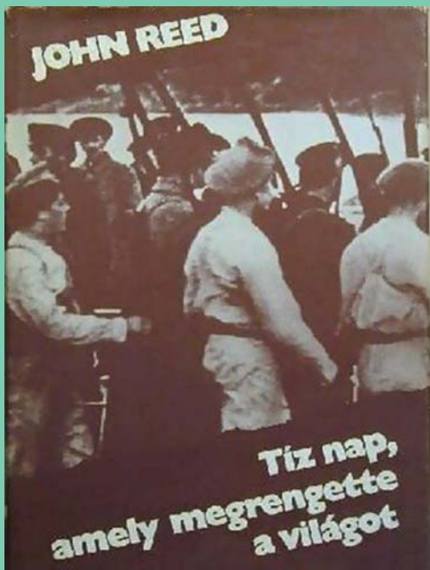
John Reed – a forradalom riportere

MANAPSÁG EGYSZERŰ A KÖNYVKIADÁS ELVE: 1917-RŐL ROSSZAT VAGY SEMMIT, DE LEGINKÁBB SEMMIT. VANNAK AZONBAN HALHATATLAN KÖNYVEK A NAGY OKTÓBERI SZOCIALISTA FORRADALOMRÓL, MELYEK MA IS IZGALMAS OLVASMÁNYT JELENTENEK. NÉHÁNYAT AJÁNLUNK FIGYELMÜNKBE.