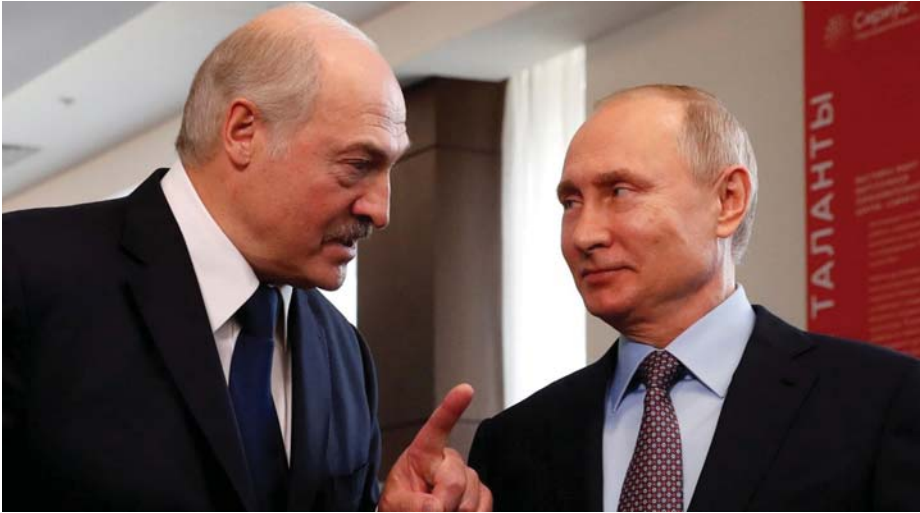
Lukasenko belarusz és Putyin orosz elnök

ben – a lukasenкои politika mellett – az áll, hogy az emberek megértették: a nyugat nem gazdagságot, hanem szegénységet és megosztottságot hoz. Nem fejlett nyugat lenne Belarusból, hanem egy megnyomortított Ukrajna.