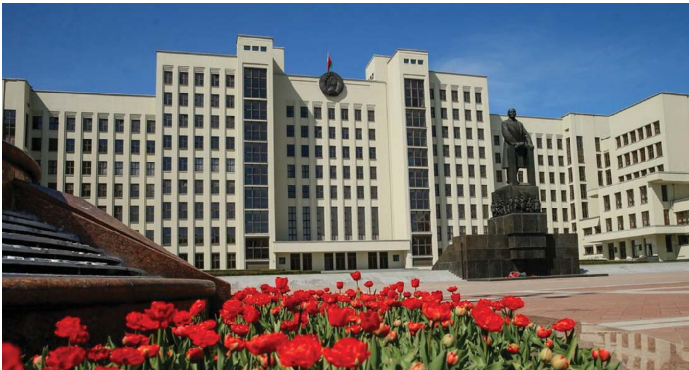
A belarusz parlament épülete

Február 25-én választják meg a Belarusz Köztársaság új parlamentje és a helyi önkormányzatok képviselőit. A világ inkább az elnökválasztásokra figyel. Legutóbb 2020-ban megkísérelték megbuktatni Alexandr Lukasenko elnököt, és hosszú hónapokig folytak az ellenzék utcai megmozdulásai. A nép azonban az elnök mellé állt, és megindult a politikai konszolidáció folyamata. A mostani parlamenti választás e folyamat fontos állomása, és mint ilyen, fokozott érdeklődés kíséri Belaruszban és külföldön is.