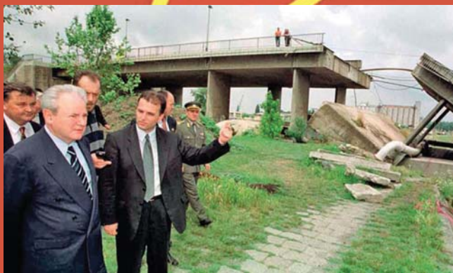
SLOBODAN MILOSEVIC JUGOSZLÁV ELNÖK A LEROMBOLT HÍDNÁL