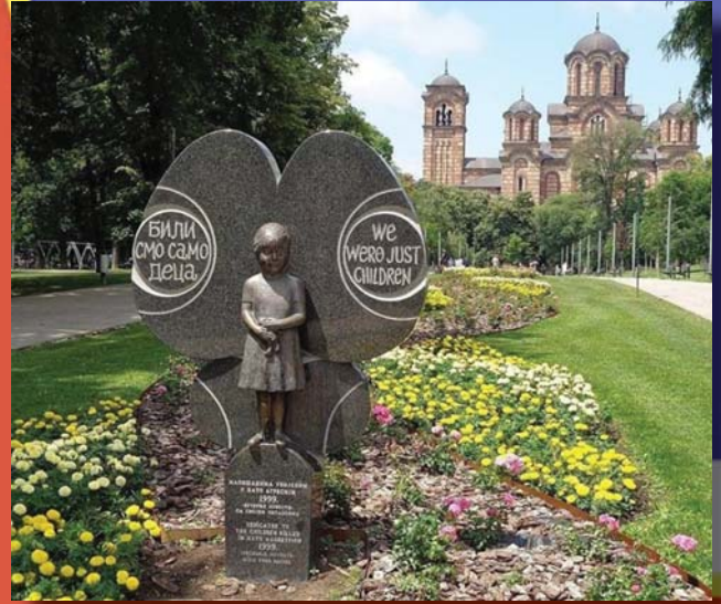
„MI CSAK GYEREKEK VOLTUNK”, MIÉRT KELLETT MEGHALNUNK? BELGRÁDI EMLÉKMŰ AZ AGRESSZIÓ SORÁN MEGHALT GYERMEKEK EMLÉKÉRE