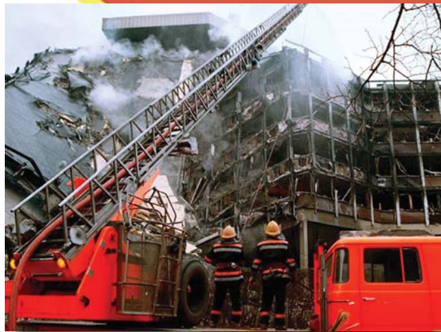
1999 ÁPRILISA: TÜZOLTÓK A LEROMBOLT BELGRÁDI ÉPÜLETEKNÉL

A NATO újdonsült tagjaként a háborúba Magyarország is belekeveredett. Taszár amerikai bázis lett, az USA használta a magyar légteret és vasutakat. Bombázták a Vajdaság magyar lakta területeit. Magyarországon a Munkáspárt tiltakozott és tüntetett a háború ellen.