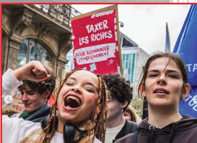
A BELGA MUNKAPÁRT A MILLIÁRDOSOK MEGADÓZTATÁSÁT, A FEGYVERKEZÉS MEGÁLLÍTÁSÁT KÖVETELI.