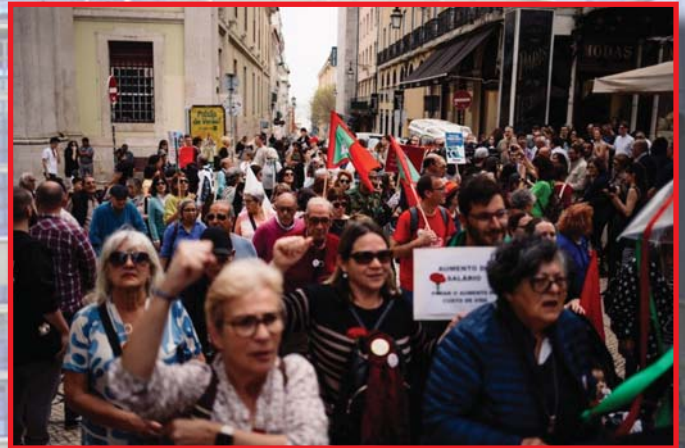
A PORTUGÁL KOMMUNISTA PÁRT A FIATALOK ÉS A NŐK MOZGÓSÍTÁSÁRA HELYEZI A HANGSÚLYT.

Június 9-én az EU más tagállamai is választanak. Eldől, hogy ki képviseli az egyes országokat az EP-ben. A harcba a kommunista és munkáspártok is bele akarnak szólni. Más Európát, a dolgozókat, a népeket Európáját akarjuk! A jelenlegi EP-ben is vannak kommunista és munkáspártok, köztük a portugál, a görög, a ciprusi, a belga, a spanyol, a cseh és más pártok. Reméljük, június 9-e után még többen leszünk. Támogassa a Magyar Munkáspártot!