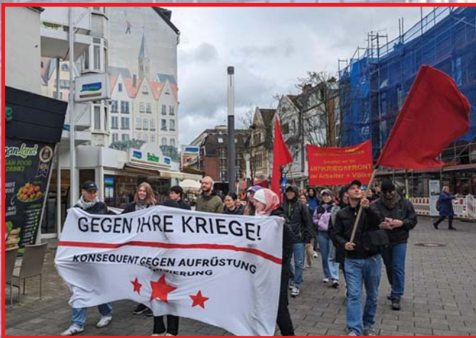
A NÉMET KOMMUNISTA PÁRT ÖNÁLLÓAN INDUL. BÉKÉT ÉS MEGEGYEZÉST OROSZORSZÁGGAL! – HIRDETIK A TŰNETÉSEIKEN.