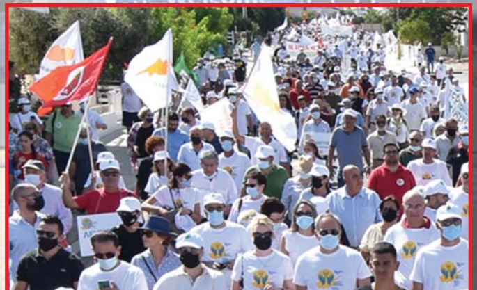
CIPRUS: AZ AKEL MEG AKARJA ŐRIZNI POZÍCIÓJÁT AZ EP-BEN