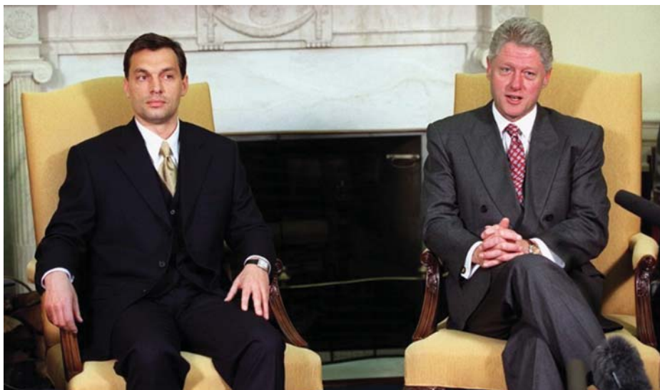
ORBÁN VIKTOR BILL CLINTON AMERIKAI ELNÖKKEL

nai elgondolásaik voltak az amerikaiaknak, hogy mit kellene Magyarországnak tenni, amit én visszautasítottam, és ezzel sikerült Magyarországot kívül tartanom a háborúból vagy háborún, és ezért nem jött létre egy szerb–magyar háború, ami szerintem tragikusan pecsételte volna meg Magyarország következő évtizedeit, nem beszélve a Délvidéken élő, akkor még 300 ezres magyar közösség sorsáról.”