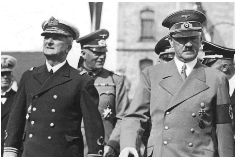
HORTHY MIKLÓS KORMÁNYZÓ ADOLF HITLER NÉMET KANCELLÁRRAL

1941-ben azonban Horthy beleegyezett a Szovjetunió elleni háborúba. Katonaként tudhatta, hogy az 1938-es győri fegyverkezési program ellenére a magyar haderő nem korszerű és a magyar hadsereget szét fogják verni. A Szovjetunió Trianon felülvizsgálatát igényelte, ha nem lépünk be. Horthy mégis belement a