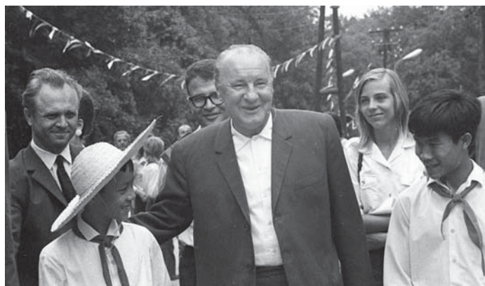
1973: Kádár János a csillebérci úttörőtáborban