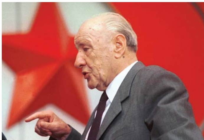
1988: Kádár János az MSZMP pártértekezletén