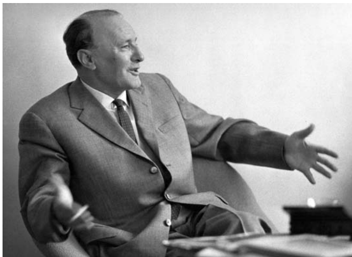
1966: Kádár János beszélgetés közben