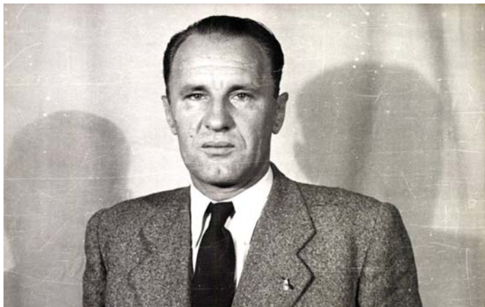
1949: Kádár János belügyminiszterként

JÚLIUS 6-ÁN A MUNKÁSPÁRT MEGEMLEKEZIK KÁDÁR JÁNOS HALÁLÁNAK ÉVFORDULÓJÁRÓL. FELIDÉZZÜK A MAGYAR SZOCIALIZMUS ÉVTIZEDEIT, ÖSSZEVETJÜK A MÁT A MÚLTAL, S GONDOLKODUNK, MIKOR IS VOLT JOBB A MAGYAR EMBERNEK. A FORTEPAN SZABADFELHASZNÁLÁSÚ FOTÓGYŰJTEMÉNYNEK KÖSZÖNHETŐEN FELIDÉZZÜK ARCÁT, MOSOLYÁT, NEVETÉSÉT IS.