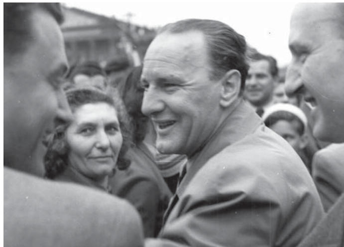
1957: Kádár János a május elsejei felvonuláson