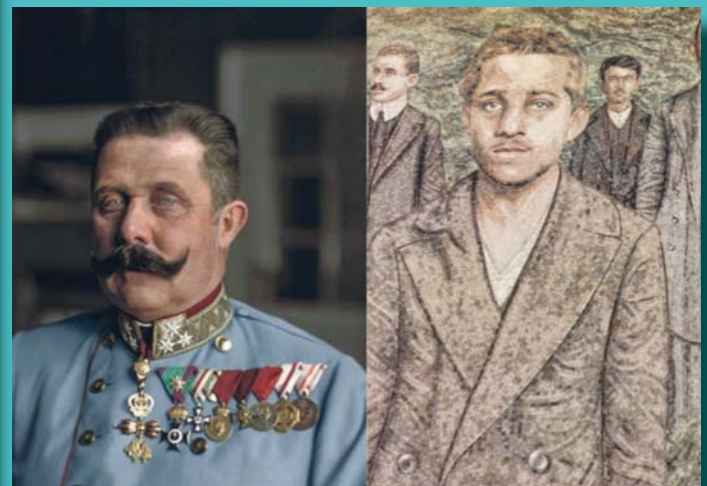
FERENC FERDINÁND ÉS GAVRILLO PRINCIP