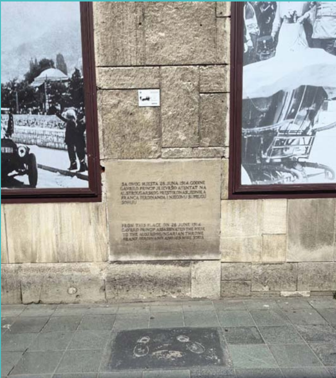
EZEN A HELYEN TÖRTÉNT A SZARAJEVÓI MERÉNYLET