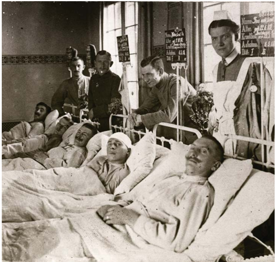
MAGYAR SEBESÜLTEK A TÁBORI KÓRHÁZBAN

1. Az első világháborút a tökés országok közötti ellentétek váltották ki. A tökés rendszer fejlődése mindenütt új szakaszába, az imperializmus korszakába lépett. A hagyományos magáncégek helyét óriásvállalatok, monopóliumok vették át. A banktőke egybeolvadt az ipari tőkével. A német és az orosz tőke gyors fejlődése sértette az Európát hagyományosan uraló brit, francia tőke érdekeit. A tökés erők mind-mind új piacokat akartak. Ellentéteiket már nem tudták békés úton rendezni, és az akkori Európa szövetségi rendszerei már nem voltak alkalmasak a háború megakadályozására.