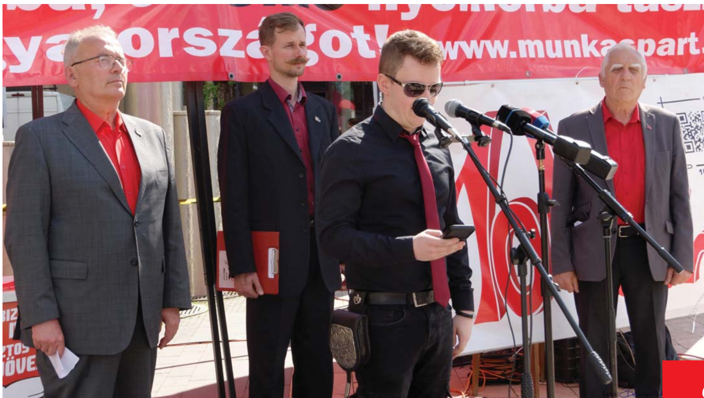
A MUNKÁSPÁRT HÁBORÚ ELLENES TŰNTETÉSE 2024 NYARÁN

Az elmúlt években a Munkáspárt számtalan háborúellenes gyűlést tartott. Könyvet adtunk ki a NATO-ról. Támogattuk a békeszerető erők összefogását. Nemzetközi téren elítéljük a NATO-t és támogatjuk a megegyezést Oroszországgal.