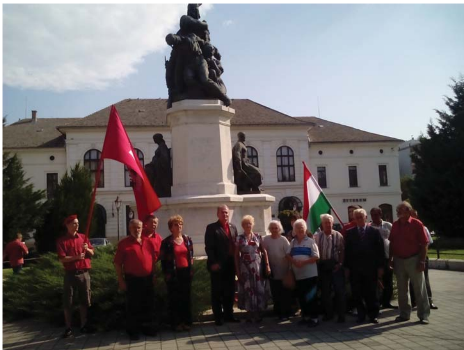
A MUNKÁSPÁRT MEGEMLEKEZÉSE MAKÓN 2014 AUGUSZTUSÁBAN

A Munkáspárt ellenzi a háborút. A háború minden terhe a dolgozó tömegek vállára nehezedik, a vagyonos osztályok hasznot húznak minden bajból, amely a népet sújtja.