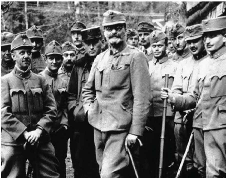
TISZA ISTVÁN MINISZTERELNÖK A KATONÁK KÖZÖTT

5. A Tanácsköztársaság sokat tett a dolgozókért, de egyben a magyar nemzetért is. 1919-ben a Tanácsköztársaság honvédő háborút folytatott a tőkés Csehszlovákia és Románia, illetve az Antant ellen. Ez volt a 20. század folyamán az egyetlen alkalom, amikor Magyarország külső segítség nélkül magyar területeket szerzett vissza. A magyar munkás-paraszt hatalom 133 napig állt fenn. 1919 augusztusában a magyar földbirtokos osztály ellenforradalmi erői az Antant segítségével levertek.