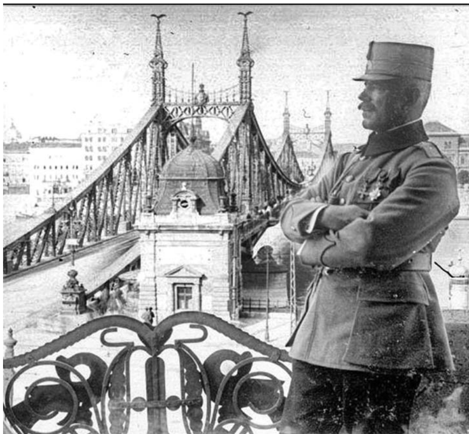
BUDAPEST ROMÁN MEGSZÁLLÁS ALATT 1919-BEN

Magyarország 20-21. századi történelmének nagyobbik része kapitalista viszonyok között zajlott. Magyarországon két ízben volt szocialista rendszer, 1919 márciusától augusztusig, és 1948-tól 1990-ig. A tőkés időszakokban Magyarország két világháborúban vett részt, és részese volt korunk nagy háborúinak is, a Jugoszlávia elleni agresszióknak, az iraki és afganisztáni háborúknak.