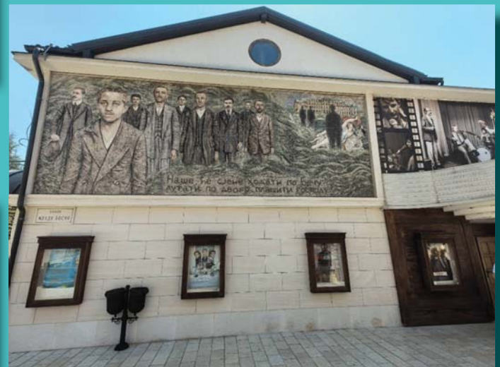
GAVRILLO PRINCIP ÉS TÁRSAI A BOSZNIAI ANDRICGRAD EMLÉKMŰZEUMÁNAK HOMLOKZATÁN