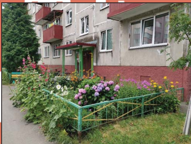
SOK ZÖLD, ÉS VIRÁG MINDENÜTT! EZ MINSZK!