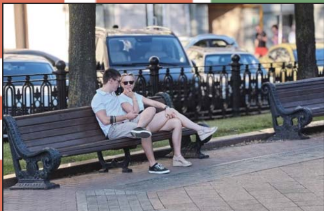
MINSZK – A FIATALOK VÁROSA