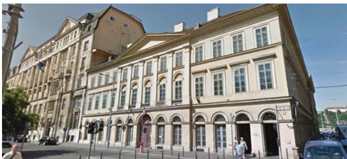
AZ EGYKORI POSTA BANK SZÉKHÁZA A JÓZSEF NÁDOR TÉREN 2024-BEN

Mondhatni persze, hogy nincs pénz. Lehet, de az is biztos, hogy van lustaság, nemtörődömség.