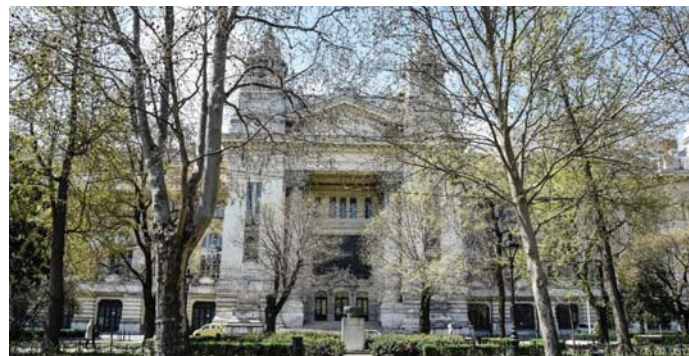
AZ EGYKORI TŐZSDE PALOTA ÜRESEN A SZABADSÁG TÉREN

A kapitalizmus következménye a vásárlási szokások átalakulása. Nem az emberek alakították át, hanem a nagy tőkés cégek erőltették ránk, elhitetve, hogy ez a modern, a kényelmes, a jó. A vásárlók ezért átpártoltak a plázákba, a szupermarketekbe. Az ilyen üzletek mindenütt egyformák, a kiszolgáló személyzet alulfizetett és képzetlen, és minden többre is kerül, hiszen a plázák bérleti díját is meg kell fizetni, illetve meg kell fizettetni velünk.