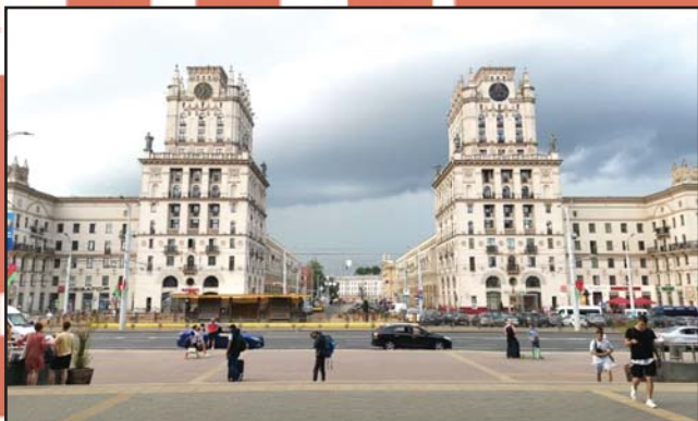
MINSZK „KAPUJA” A VÁROSKÖZPONTBAN. A HÁBORÚ UTÁNI ÉPÍTÉSZETI STÍLUS EGYEDÜLÁLLÓ GYŰJTEMÉNYE VAN MINSZKBN.

Minszkbe, a belarusz fővárosba manapság nem egyszerű eljutni. Az EU-szankciók miatt Európából közvetlen repülőjárat nincs. Képeinkkel segítünk egy kicsit belekóstolni Minszkbe, és reméljük, hogy a háború egyszer véget ér, és gond nélkül tervezhetünk utazást Belaruszba.