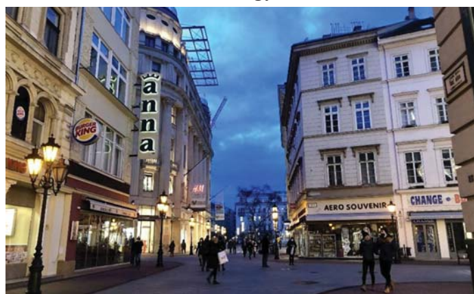
VÁCI UTCA ESTE MA

Alig van nyilvános WC. Akinek szerencséje van, bejut egy kávézóba, de melyik kávézó örül az ilyeneknek. Ha nincs WC, marad az utca, és ez sajnos meg is látszik sok utca járdáján. A nyilvános WC pedig nem luxus, hanem létszükséglet egy világvárosban. És nem csak a külföldieknek, ugyebár!