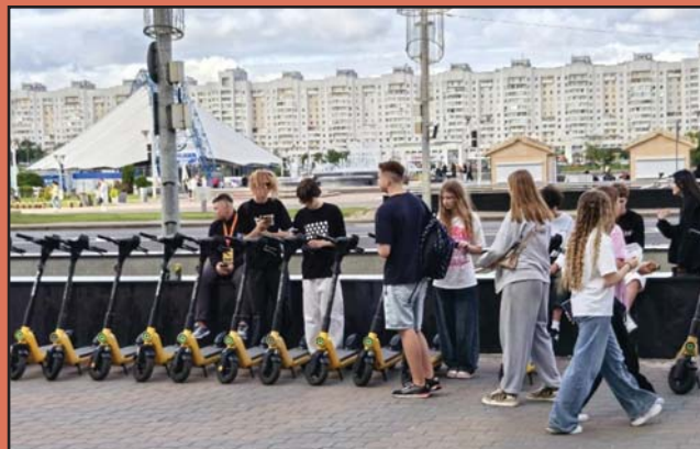
A ROLLER ÓRÜLET IDE IS BETÖRT.