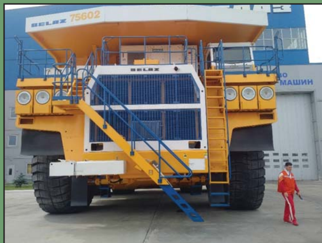
BELARUSZBAN MEGŐRIZTÉK A NEMZETI IPART. AZ ÓRIÁSDÖMPEREKET AZ ÁLLAMI TULAJDONÚ BELAZ GYÁRTJA.