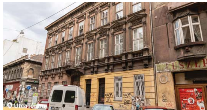
BUDAPEST, TERÉZVÁROS, JÓKAI UTCA MOSTANSÁG.

Az utcákon tessék vigyázni, mert mifelénk egyenletes út alig van. Ahol valahol kábelt fektetnek, vagy csőtörés volt, ott felbontják az aszfaltot. Vissza is rakják, de ez csak egy folt az úton, és nem egyenletes felület. Azt mondják, az osztrákok más szabvány szerint javítják az utakat. De az is lehet, hogy egyszerűen szeretik a rendet a házuk táján.