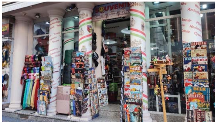
VÁCI UTCA – TURISTA BÓVLI MINDEN MENNYISÉGBEN

Öröm végig sétálni az Andrássy úton is. A palotákat rendbe hozták. Az más kérdés, hogy ki engedhet meg magának ott egy lakást. A Kodály köröndön havi 355 ezerért már lehet