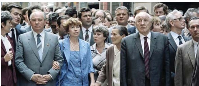
MIHAIL GORBACSOV ÉS KÁDÁR JÁNOS A VÁCI UTCÁBAN 1986-BAN

A Váci utca neve nem változott, de az utca maga igen. 1986-ban Kádár János még a Váci utcára vitte sétálni