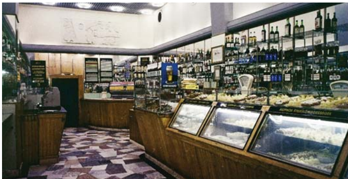
MÉZES MACKÓ A KÍGYÓ UTCÁBAN

Apropó. önkormányzatok! A hivatali épületek az osztrák városokban is zárva vannak este és munkaszüneti napokon, de szinte mindenütt van egy nyitott pult vagy helység, ahol az arra tévedő információkat kaphat. Nálunk ilyen nincs, vasárnap ne kérjen senki információt!