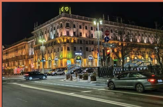
A BELVÁROS SZÍVÉBEN ESTE