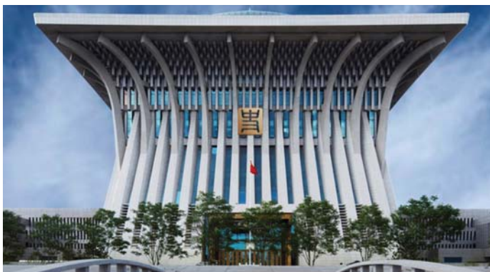
A TÖRTÉNELEMTUDOMÁNYI AKADÉMIA PEKINGBEN

let-európai kommunista pártokban előretörték a szociáldemokrata és liberális erők. A marxista erők nem tudtak úrrá lenni a szellemi válságon.