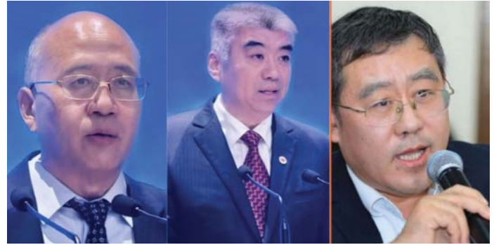
ZHEN ZHANMIN , A CASS ALELNÖKE, CHEN ZHOU , A KKP KÖZPONTI BIZOTTSÁGA KÜLÜGYI OSZTÁLYÁNAK MINISZTERHELYETTESE, XIN XIANGYANG , CASS MARXISTA INTÉZETÉNEK ELNÖKE

Xin Xiangyang , a CASS Marxista Intézetének elnöke három szempontból magyarázta a kínai stílusú modernizáció globális jelentőségét: az elméleti rendszer, a gyakorlat és a kínai stílusú modernizáció által létrehozott eredmények. Megemlítette, hogy a történelem, különösen a kínai sajátosságú szocializmus fejlődésének története bizonyítja, hogy a marxizmus legyőzhetetlen, és olyan befolyással rendelkezik, amellyel egyetlen más elmélet sem. A kínai modernizáció fejlődésével a marxizmus folyamatosan gazdagodott. A fejlődés ma sem állt meg. Hszi Csin-ping gondolatai a mai szocializmus problémáiról ezt a folyamatot segítik.