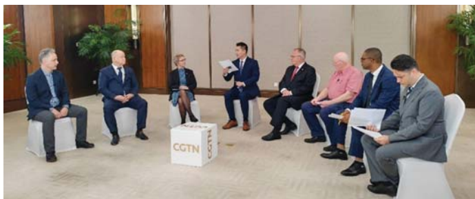
MÉDIAVITA A PEKINGI TELEVÍZIÓBAN

fel. A nyugati politika és propaganda totális háborút folytat a szocializmus mindkét tapasztalata ellen.