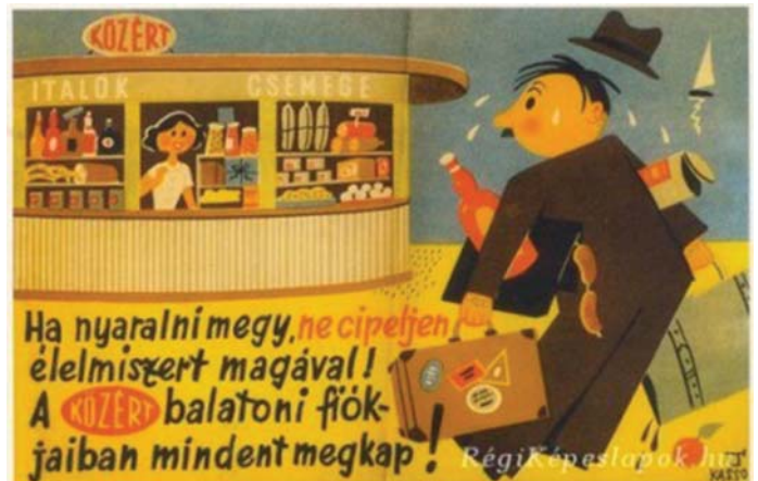
KÖZÉRT -REKLÁM A SZOCIALIZMUS ÉVEIBŐL