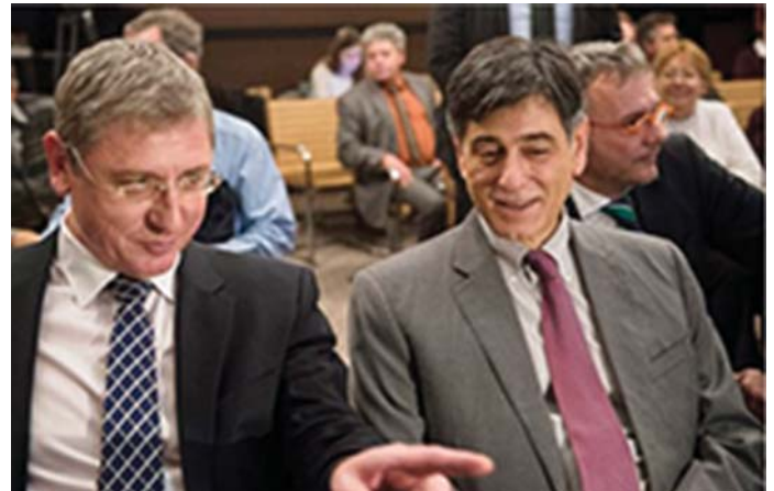
ANDRÉ GOODFRIEND GYURCSÁNY FERENC DK-ELNÖKKEL

Az 1970-es évektől elindul az enyhülés a tőkés és szocialista országok között. Bővítik a gazdasági kapcsolatokat, korlátozzák a katonai szembenállását, és lehetővé teszik az emberek közötti gyakori kontaktusokat.