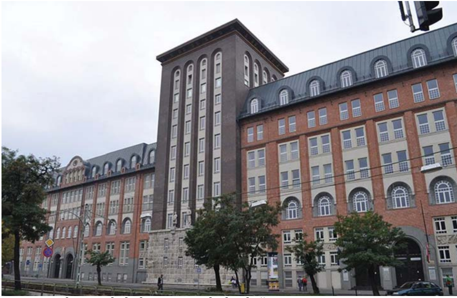
A NYUGDÍJFOLYÓSÍTÓ IGAZGATÓSÁG ÉPÜLETE BUDAPESTEN

A gyermekek felnevelése és az idősekről való gondoskodás része annak, hogy emberi lények vagyunk. A gyermek még nem tud önmagáról gondoskodni, az idős ember pedig már korlátozva van az élet számos területén.