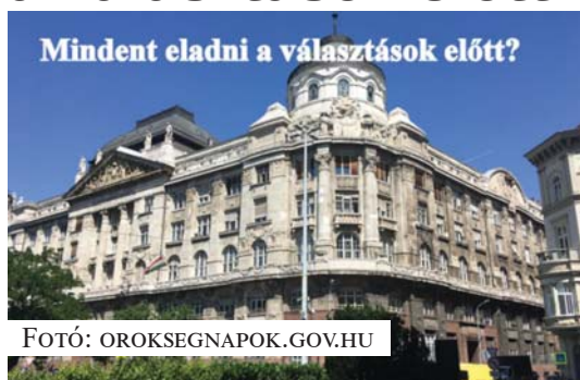
Mindent eladni a választások előtt?