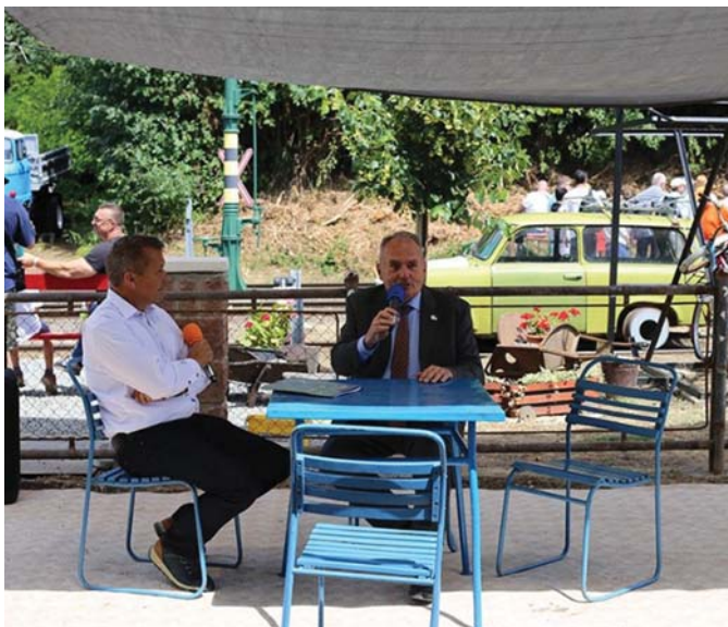
PALOTABOZSOK: LAKOSSÁGI FÓRUM