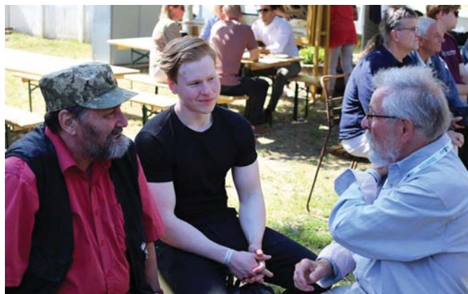
BESZÉLGETÉS A MUNKÁSPÁRT TAGJAIVAL