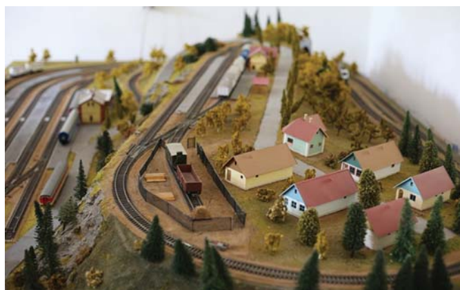
TEREPASZTAL A MÚZEUMBAN