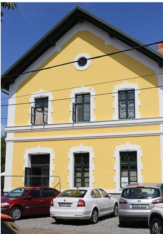
PALOTABOZSOK – EGYKOR VASÚTÁLLOMÁS, MA VASÚTI MÚZEUM