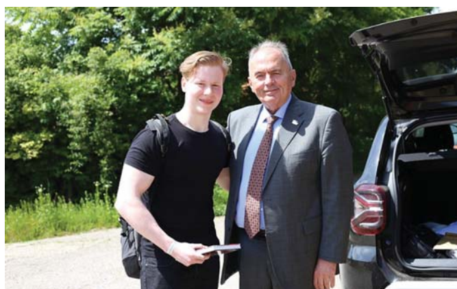
TAGKÖNYVÁTADÁS A PÁRT ÚJ TAGJÁNAK