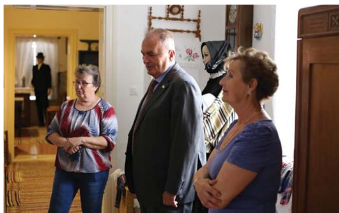
SOMBEREK: SVÁB MÚZEUM